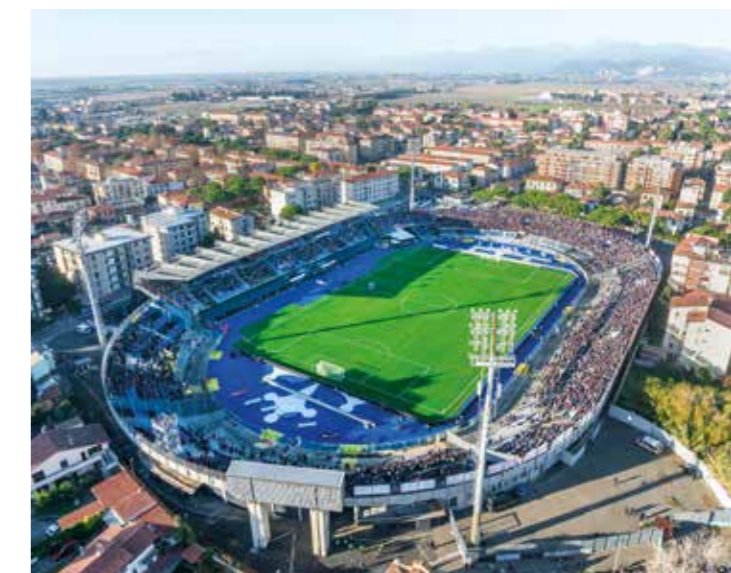
Sopra: Lo stadio di Pisa A sinistra: I campionati beach soccer 2024

physical activity as a core component of urban wellbeing. This approach builds on a strong tradition that portrays Pisa as a city genuinely in motion, where sport is both widespread and deeply rooted. It finds expression in a dense network of more than 500 associations, sports clubs and volunteers, with over 38,000 registered members across the province of Pisa. Within this ecosystem, sport takes on a broad meaning, encompassing not only competitive activity but also grassroots participation, social interaction, education and prevention. The most significant value of the bid lies in its ability to bring these elements together within an integrated vision, in which sport becomes a cross-cutting tool for promoting healthy lifestyles, preventing chronic diseases, fostering social inclusion, and enhancing overall physical and mental wellbeing. This perspective is further strengthened by the city's distinctive features, starting with the presence of an internationally recognised university and research system, which enables the integration of sports policies with scientific expertise. At the same time, Pisa benefits from a well-developed and widespread infrastructure network, including sports facilities, open spaces, and urban and natural routes that encourage access to physical activity.