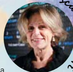
# Fosca Giannotti?

bene, ma che sappiano anche rendere ragione del proprio funzionamento, offrendo così agli studiosi, qualunque sia il loro ambito, non soltanto risposte, ma strumenti per comprenderle.