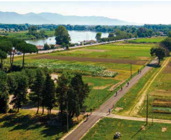
Sotto: La ciclopista del Trammino A destra: La Pisa Marathon 2025

tà, l'educazione e la prevenzione, contribuendo in modo concreto al benessere individuale e collettivo: si stimano nella città di Pisa oltre 35mila persone che praticano un'attività sportiva almeno una volta alla settimana. Il valore più significativo della candidatura risiede proprio nella capacità di mettere a sistema questi elementi all'interno di una visione integrata, in cui lo sport diventa uno strumento trasversale capace di incidere sulla promozione di stili di vita sani, sulla prevenzione delle patologie croniche, sull'inclusione sociale e sul benessere psicofisico. In un contesto segnato dall'invecchiamento della popolazione e dall'aumento della sedentarietà, il movimento si configura così come un fattore strategico di sostenibilità sanitaria e sociale . A rafforzare questa prospettiva contribuiscono le caratteristiche specifiche della città, a partire dalla presenza di un sistema universitario e di ricerca di livello internazionale che consente di integrare politiche sportive e competenze scientifiche. Questo permette non solo di progettare interventi più efficaci, ma anche di monitorarne gli impatti e sviluppare modelli innovativi che possono essere replicati su scala più ampia. Allo stesso tempo Pisa può contare su un patrimonio infrastrutturale articolato e diffuso, fatto di impianti sportivi, spazi all'aperto e percorsi urbani e naturali che favoriscono l'accesso alla pratica motoria. È un