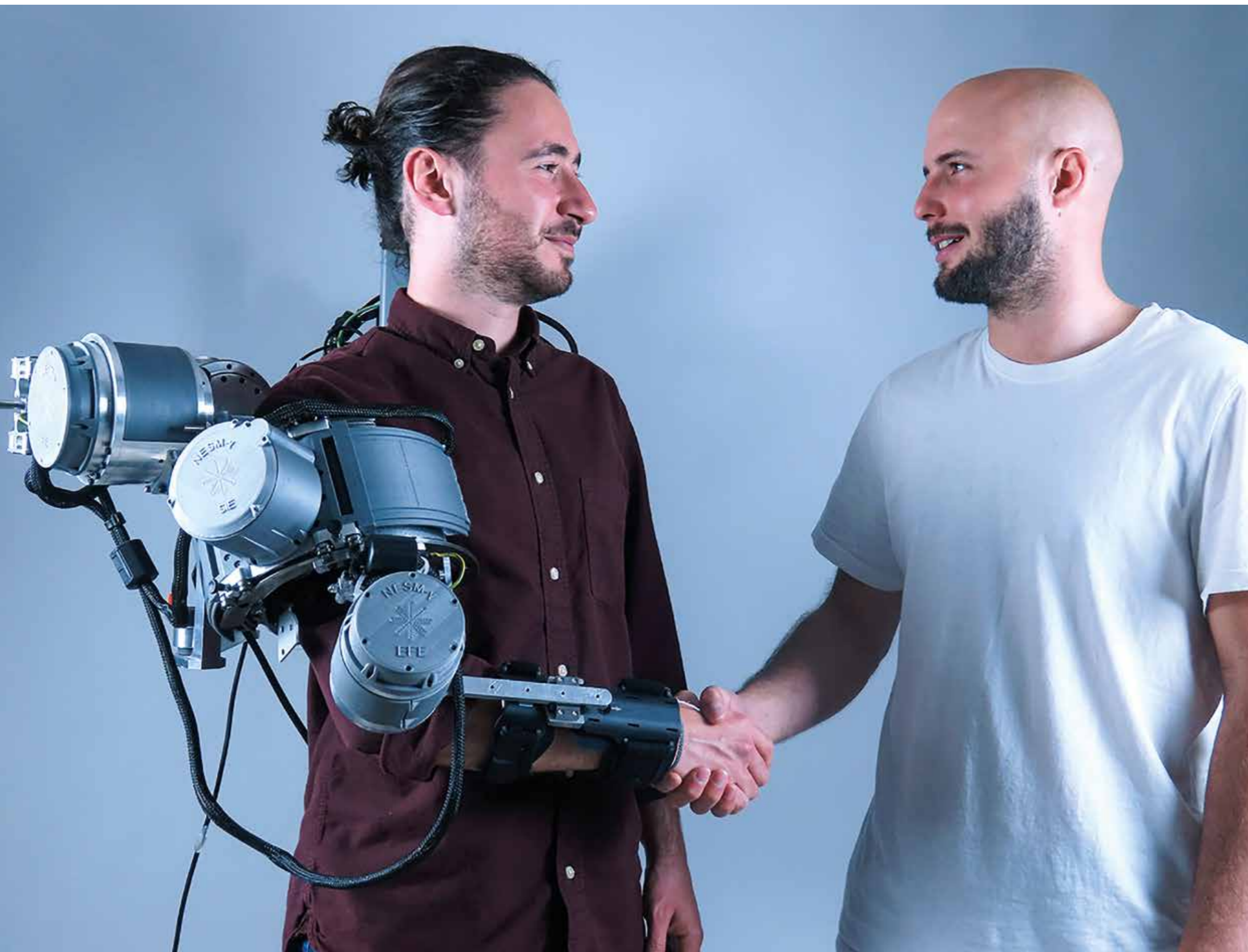
NeuroEXOS _Wearable Robotics Lab